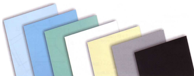
Bleu Pâle Bleu France Vert Caraïbes Blanc Sable Gris Noir