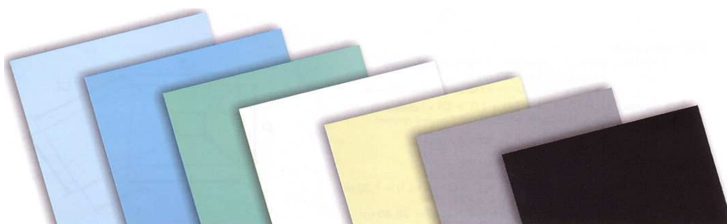
Bleu Pâle Bleu France Vert Caraïbes Blanc Sable Gris Noir